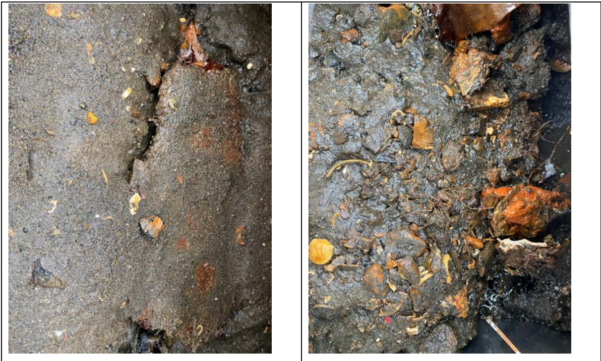
Figur 4-1 Bilder av sedimenter fra stasjon BO_1 (venstre) og BO_2. Sedimentene inneholder glødeskall / biter av rustet jern, malingsflak, biter av tau, wire m.m., i tillegg til at partikler også har et belegg av jernoksid.

Videre ble det også observert en god del skjell, ingen levende. Prøvene fra dypere deler i det undersøkte området, foran moloen og vest for denne, viste overflater som virket å være rene og uten påvirkning av aktiviteten ved verftet. Sedimentoverflaten var generelt uten slam / organisk materiale / dynn, og med frisk lukt.